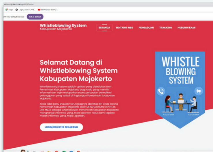
Gambar 3. Halaman Depan WBS